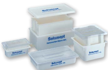
Das Sekusept® Wannen-System zur Instrumenten-Aufbereitung

Wirksystem auf der Basis aktiven Sauerstoffs, das selbst gegen unbehüllte Viren und Bakteriosporen wirksam ist. Dies führt zu einer einmaligen Wirksamkeit bei sehr kurzen Einwirkzeiten.